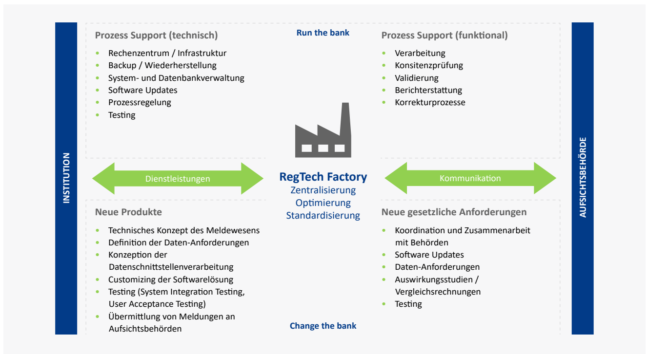
Abbildung 2: Zentralisierung, Optimierung und Standardisierung von Prozessen

Neben den beschriebenen Infrastrukturleistungen, dem Anwendungsmanagement und der Begleitung des Meldeprozesses bietet die RegTech Factory vor allem einen starken Rahmen für Standardisierung. Dies umfasst die Nutzung eines standardisierten Datenmodells sowie das Angebot von Standard-Schnittstellen zu Drittanbietern. Auch der vollumfängliche Umstieg auf Business Process Outsourcing im Bereich „Run the Bank“ und „Change the Bank“ wird somit möglich.